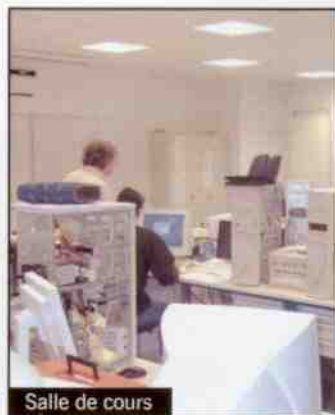
Salle de cours