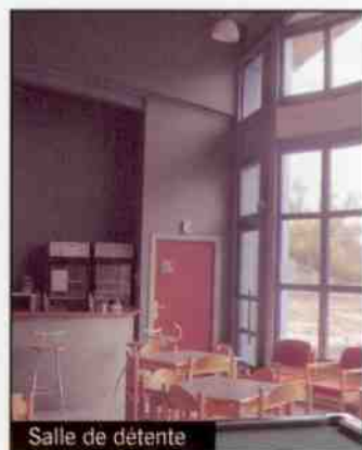
Salle de détente

Fonds européen de développement régional (Feder) et la région de Sologne. Outre les deux bâtiments d'hébergement proprement dits, une cuisine collective et un self sont aménagés avec professionnalisme par Actifroid, ainsi qu'un ensemble de locaux de vie et de détente.